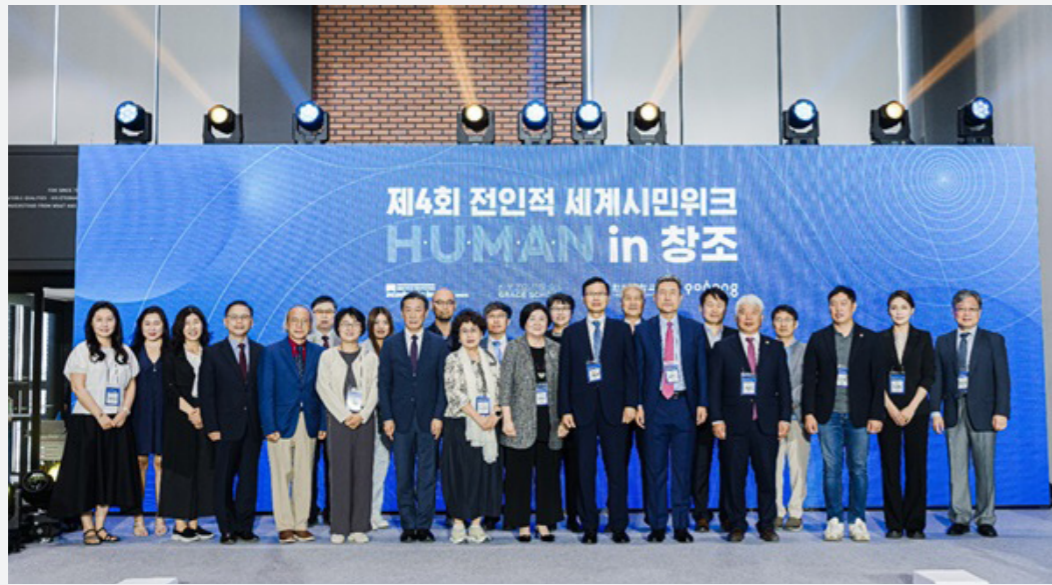
▲ 제4회 전인적 세계시민워크

유엔 아카데미임팩트 한국협회(UN Academic Impact Korea : UNAI Korea)가 지난 3일부터 4일 양일간 한동대학교 김영길 GRACE 스쿨에서 '위기의 미래, 우리는 세계시민입니까?'를 주제로 제4회 전인적 세계시민워크를 개최했다.